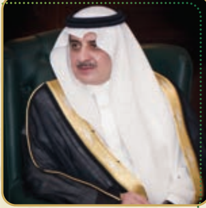
صاحب السمو الملكي الأمير فهد بن سلطان بن عبدالعزيز آل سعود رئيس مجلس إدارة جمعية الملك عبدالعزيز الخيرية بتبوك